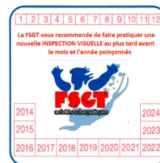
La commission TIV